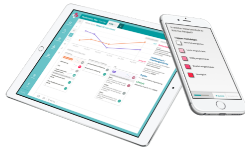
Befragung und Auswertung

Media-link: https://heartbeat-med.com/wp-content/uploads/2020/09/01_Start.png