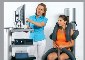
Rückenkraftdiagnostik und -Biofeedback