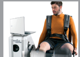
Isokinetik-Diagnostik und -Therapie