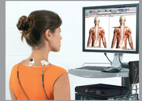
Muskelfunktions- diagnostik und Biofeedback

Anmeldung unter Tel. 02234-9900660 oder info@sinfomed.de