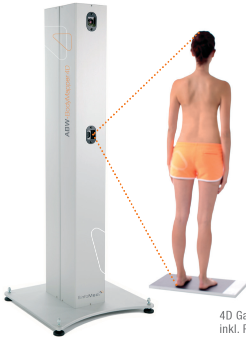
4D Ganzkörperdiagnostik inkl. Pedobarographie