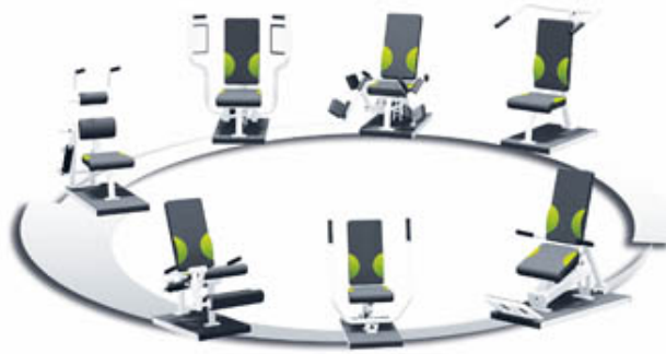
Bild Nr. 42-01 SU_AtamaCircle-II.jpg Schupp stellt mit der hydraulischen Zirkelgeräte-Serie ATAMA CIRCLE II seine neuesten MTT-Geräte für ein einfaches, effektives und dabei schonendes Ganzkörpertraining vor.